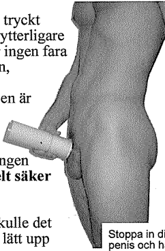
Stoppa in din penis och håll tills det stelnar.

Dra nu försiktigt ut din snopp ur tuben. Skulle det rinna ut blandning på golvet så torkas det lätt upp med varmt vatten.