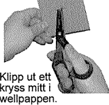
Klipp ut ett kryss mitt i wellpappen.

Ta en 10 cm fyrkantig bit wellpapp och klipp ett litet kryss i mitten. Tryck igenom den medföljande vibratoren tills bara skruvkorken sticker upp. Stick nu försiktigt ner din konstruktion i mitten av din gummifyllda form tills den vilar på formens kant. Försök få ner vibratoren så långt som möjligt utan att doppa den helt, då kan du inte byta batteri. Låt nu hela konstruktionen stå i 24 timmar..