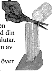
Märk upp och klipp ner tuben till rätt storlek.

Den delen kommer senare att pressas mot din kropp vid gjutningen.